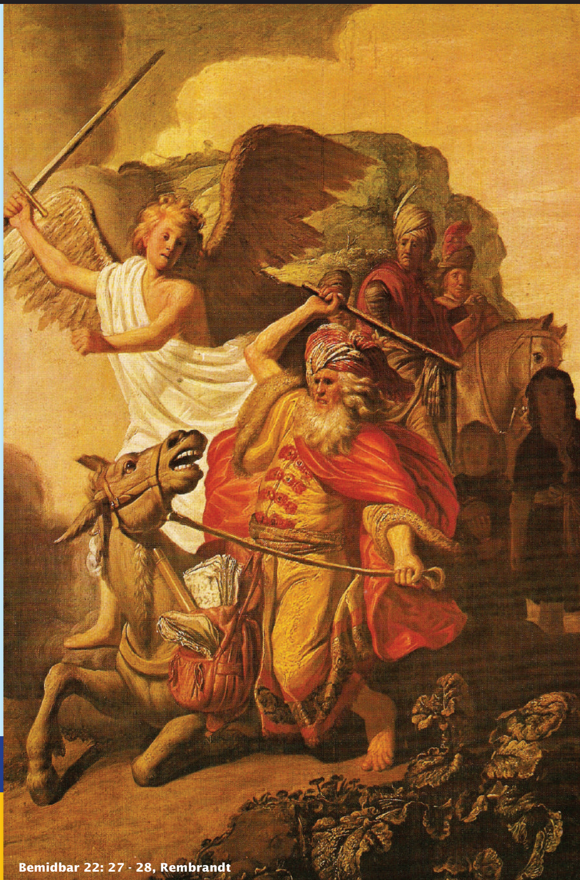
Bemidbar 22: 27 - 28, Rembrandt