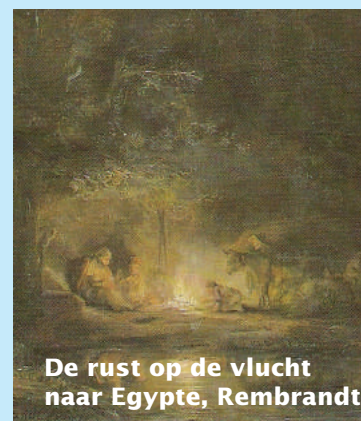
De rust op de vlucht naar Egypte, Rembrandt

Het verwarmt ons en houdt ons in leven. En het zit vol verrassingen. Door studie moeten wij het blijven aanblazen. Want dat vuur gedijt het beste bij nieuwsgierigheid en bij het