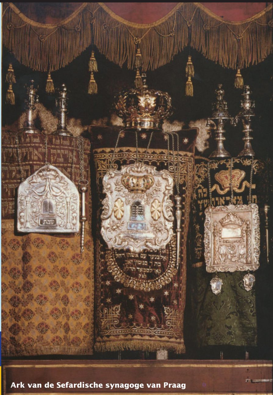
Ark van de Sefardische synagoge van Praag

Soekot za. 3 okt. Simchat Tora za. 10 okt.