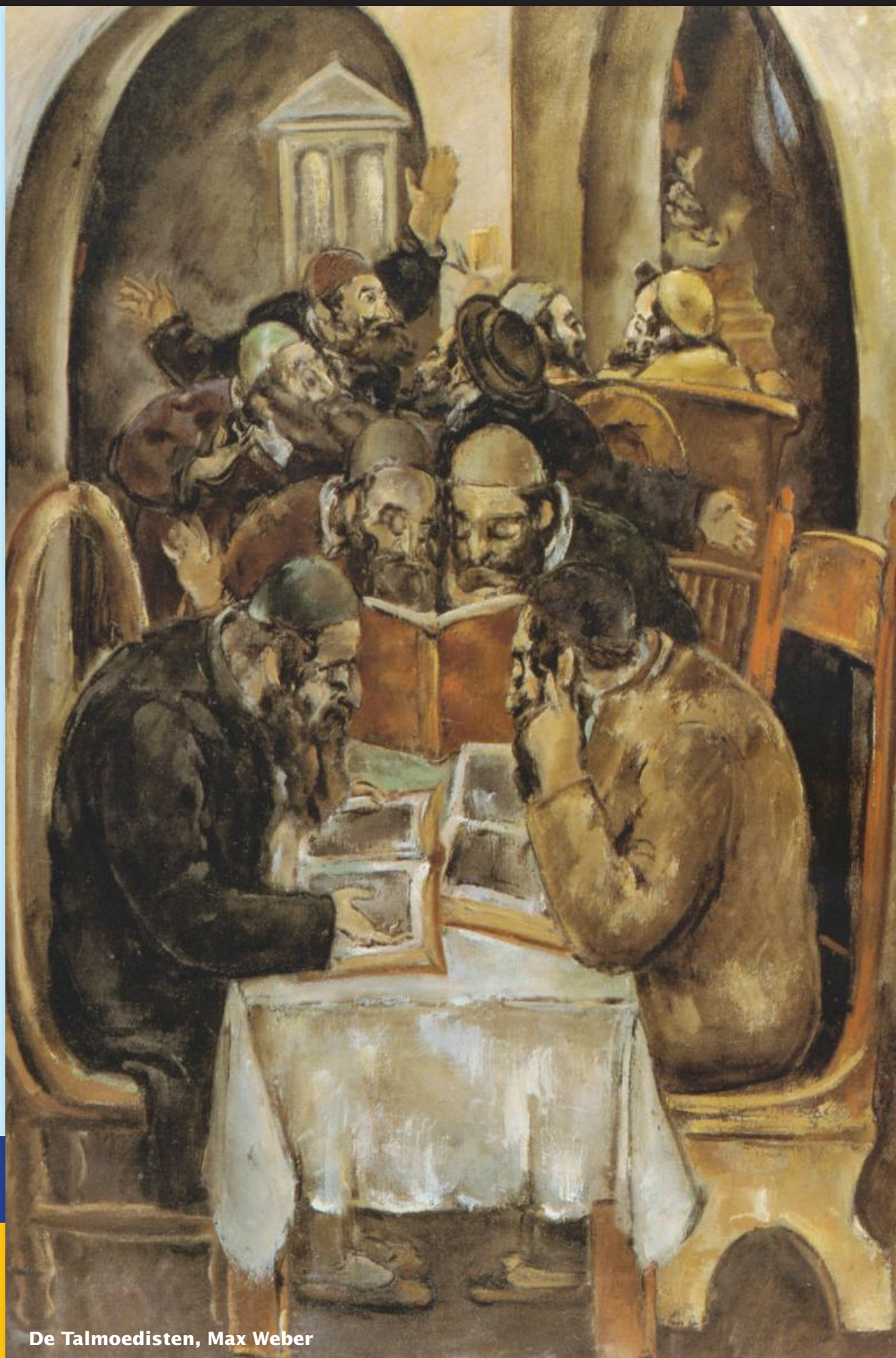
De Talmoedisten, Max Weber