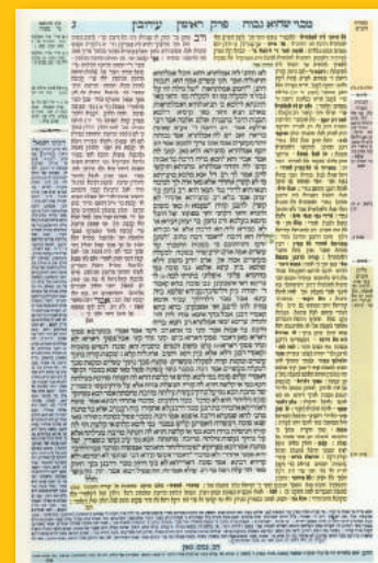
Babylonische Talmoed pagina indeling 1 e druk