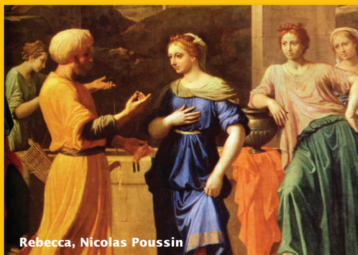
Rebecca, Nicolas Poussin

Wat kunnen moderne mensen, in de 21e eeuw, nu nog leren van en over 'vrouwen van toen'? Leven wij niet in een volkomen andere samenleving? En wie zijn die vrouwen dan? Zijn het alleen moeders, dochters en echtgenotes? Of ook heksen en wijze vrouwen? Kennen we vrouwen in Bijbelse tijden in topfuncties? En op welke manier oefenden zij hun invloed uit? Deze, en nog veel meer interessante vragen, zullen we verkennen aan de hand van teksten uit Tenach. Met bekende en onbekende namen wordt dat een boeiende speurtocht.