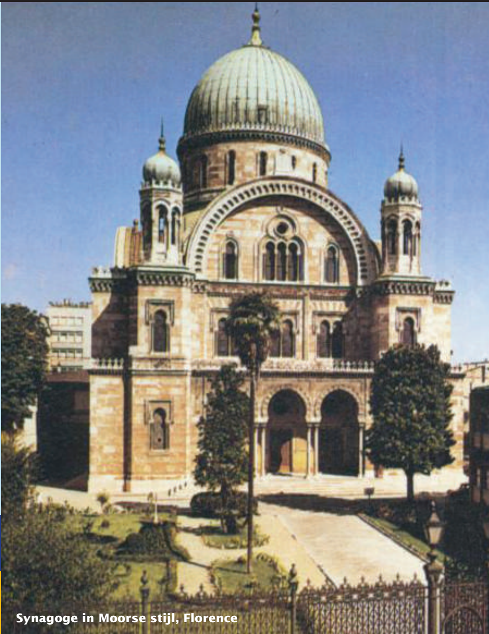
Synagoge in Moorse stijl, Florence